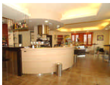
il Bar della Locanda