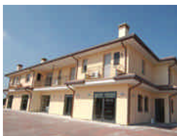
Locanda degli Este

Locanda "degli Este" - Via Canale Ippolito, 16/A - Caprile di Codigoro (FE) - Tel. 0533/932066.