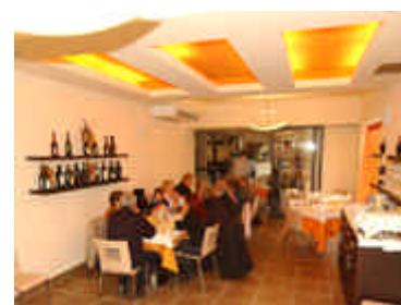
il Ristorante della Locanda