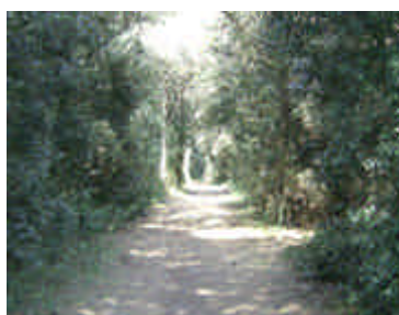
Pineta di Volano