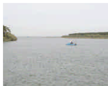
Foce del fiume Po di Volano