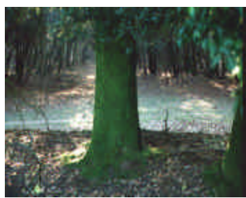
Pineta di Volano